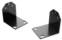
DW-G419RE Oreilles pour montage en rack 19